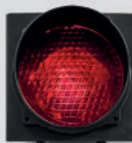
ROOD VERKEERS- LICHT