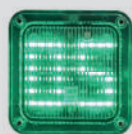
LED WAARSCHU- WINGSLAMP met afteller