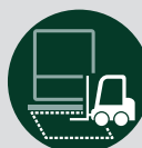
ONTVANGER VOOR LUS- DETECTOR (exclusief inductielus)