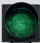
GROEN VERKEERS- LICHT