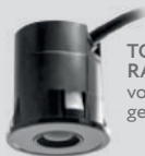
TOF/SPOT RADAR voor binnen- gebruik