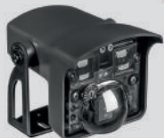
CONDOR RADAR met stilstand detectie