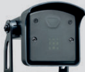
FALCON RADAR met instelbare bewegingssensor