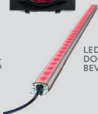
LED DOORGANGS- BEVEILIGING