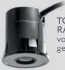
TOF/SPOT RADAR voor binnen- gebruik