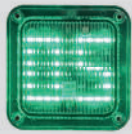
LED WAARSCHU- WINGSLAMP met afteller