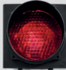
ROOD VERKEERS- LICHT