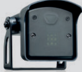
FALCON RADAR met instelbare bewegingssensor