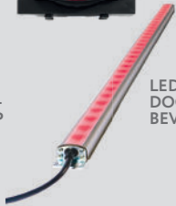
LED DOORGANGS- BEVEILIGING