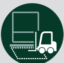
ONTVANGER VOOR LUS- DETECTOR (exclusief inductielus)